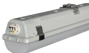
Snabbkoppling i varje gavel