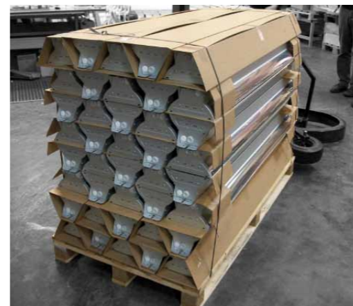
Armaturen kommer lastad i pallar, vilket gör det enkelt att transportera materialet.

– Vi är jättenöjda med belysningen och vi kan varmt rekommendera den till andra. Vi håller redan på att utrusta vårt lager i Jordbro med samma armaturer.